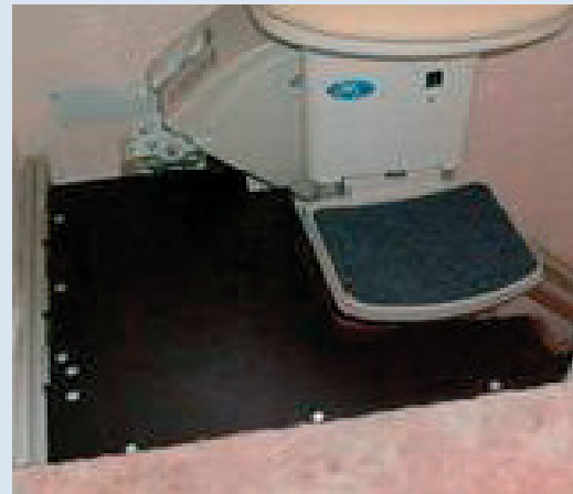
Die automatische Plattform wird nach Maß gefertigt, um die größte Passgenauigkeit zu realisieren.

Diese gestattet notfalls auch das Zusammenklappen der Plattform von Hand.