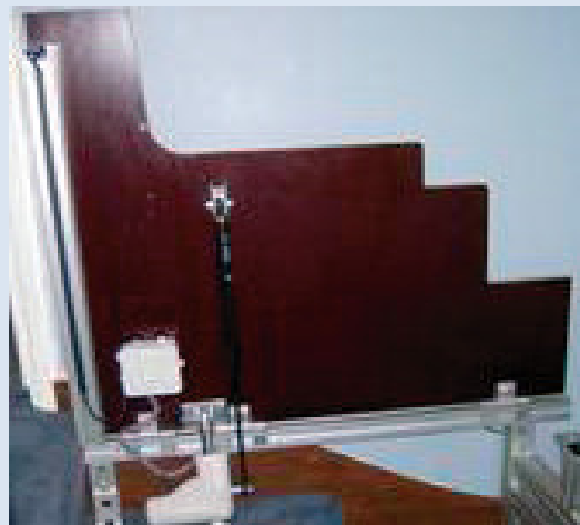
Die automatische Plattform ist zusammenklappbar und lässt die Treppe für andere Benutzer frei.